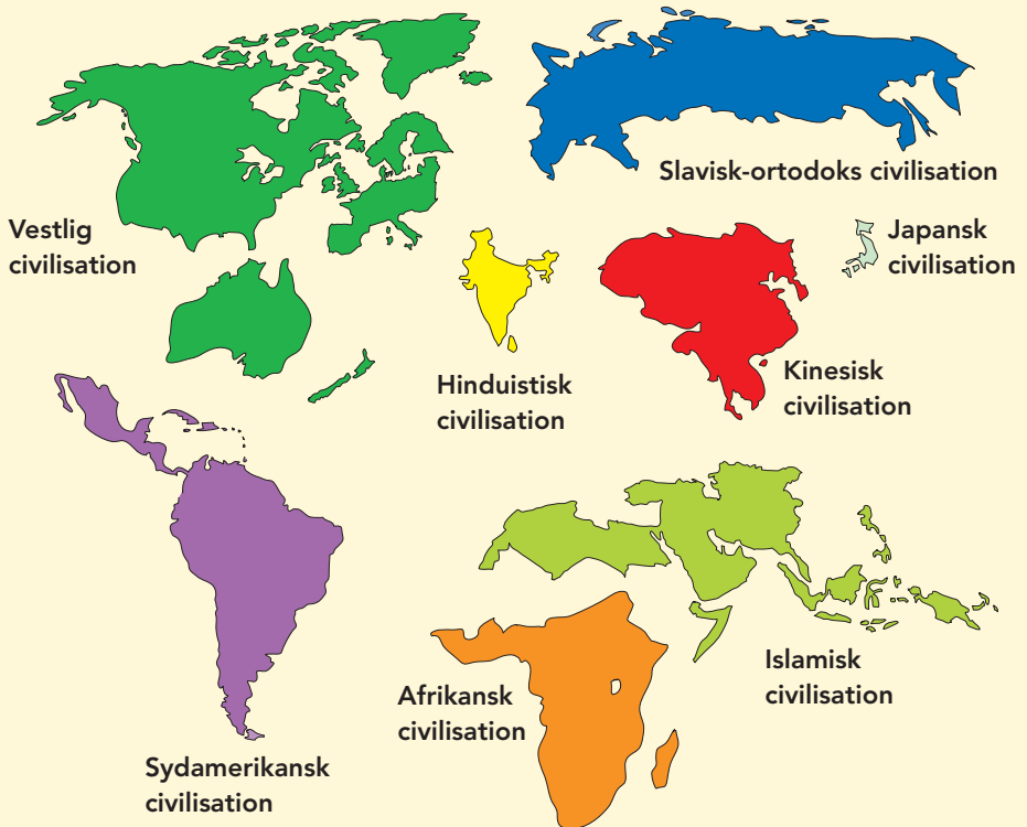
Fig. 24.3 Verdens civilisationer i Huntingtons forestillingsverden.