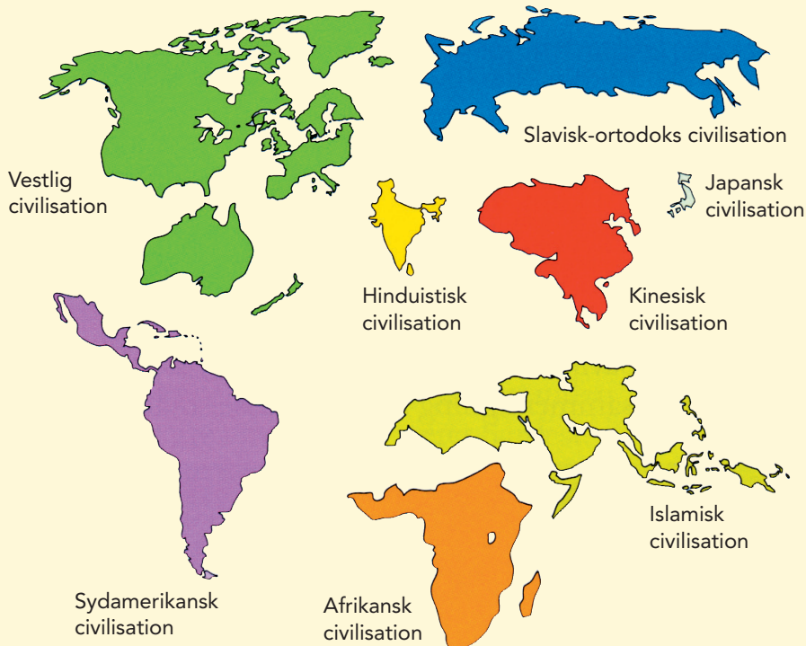
Fig. 17.4 Verden opdelt i civilisationer.