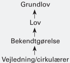
Fig. 1.2 Oversigt over lovhierarkiet.