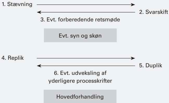
Fig. 1.7 Oversigt over forberedelsen af en civil retssag.