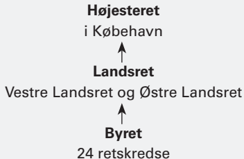
Fig. 1.4 Domstolenes hierarkiske opbygning.